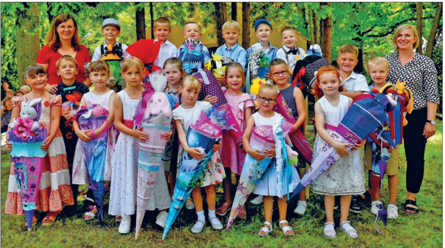
Klasse 1 b