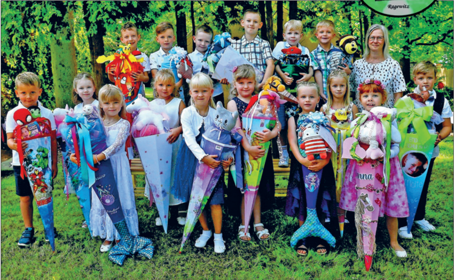
Klasse 1 a