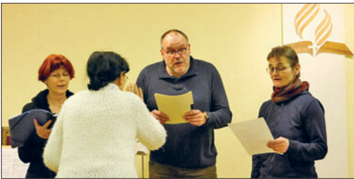
Vocaltrio Schweta (21.01.24)