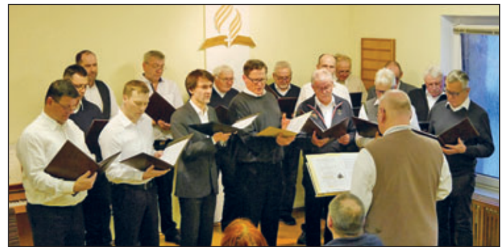
Männerchor Zschaitz (21.01.24)